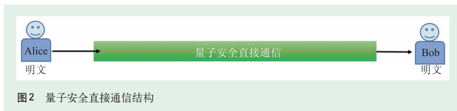
图2 量子安全直接通信结构

2000年龙桂鲁和博士生刘晓曙提出了国际上首个量子安全直接通信方案 [2] ，2003年龙桂鲁和博士生邓富国、刘晓曙提出了两步量子安全直接通信方案 [19] ，2004年龙桂鲁和邓富国提出了基于单光子的DL04量子安全直接通信方案 [20] 。近年来，量子安全直接通信得到了快速的发展，受到了广泛的重视。2016年龙桂鲁与山西大学肖连团教授合作，提出频率编码的单光子量子直接通信方案，并在实验上进行了原理验证，实现了噪声环境下的量子直接通信 [21] 。2017年中国科学技术大学郭光灿院士、史保森教授团队和南京邮电大学盛宇波教授团队合作，利用量子存储验证了龙桂鲁等提出的量子安全直接通信方案 [22] ，2017年清华大学张巍及其博士生朱峰、黄翊东教授与南京邮电大学盛宇波教授联合实验组首次在500 m光纤中实现了龙桂鲁等的量子安全直接通信方