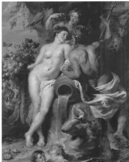
图 4 油画: 大地与水的结合 (鲁本斯, 1618)。水在大地中的 segregation 的形象扎根于人类早期对生命起源的思考

此文的大部分内容为我博士学位论文的后记部分 (postscript)。关于择优溅射引起的扩散偏析问题的处理, 详细内容包括概念的辨析、模型建立、解微分方程、设计实验和数据分析, 都体现在我的 JPCM (2001) 论文中 [3] 。其结论是表面分析常用的溅射轮廓剖析方法是一个条件不足的逆问题, 只在某些特殊条件下才可以获得近似可靠的结果。虽然至今我已经在像 PRL, APL, Science 等国际杂志上发表了 50 余篇研究论文, 但我认为我做得最系统的、也是