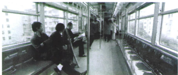
图 3 社会生活中的偏析现象: 胆小的市民们自动躲到车厢的一端, 剩下三个骗子留在原地。

把 segregation 译成偏析或分凝, 很大程度上固化了其物理或材料过程的色彩, 而实际上 segregation 是一个很社会化的词。对南非实施多年的种族隔离政策 (apartheid) 的解释是 the policy of strict racial segregation and political and economic discrimination against nonwhites as practiced in South Africa 其中 segregation 指的是不同特征的人自动或被动聚集成堆的现象 (图 3), 这时中文用偏析或冷凝似乎都缺乏人情味。此外, 水作为大地上最丰富的矿藏, 其在大地中的 segregation 行为承载着更多的文化内涵 (图 4)。