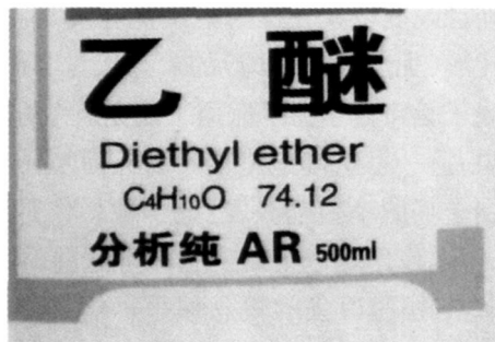
图 2 作为化学药品的 ether 中文译为乙醚. 醚, 从迷, 让人不由想起十字坡孙二娘的蒙汗药

“quintessence (第五种存在, 又译第五元素, 英文直接写成 “The Fifth Element”, 引申为精英或天上掉下来的 )”的原子. 到 1596年, 开普勒的书 “Mysterium Cosmographicum” (宇宙的谜团) 中还有这种说法. 如果非要以太长什么样的话, 可以认为它是由正十二面体累积而成的.