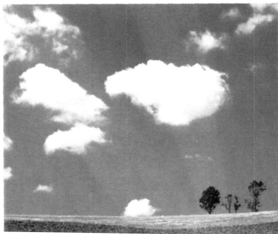
图 1 以太，夏天的感觉

希腊，以太指的是青天或上层大气，不过从思想的层面上，以太的概念来自古希腊关于物质存在形式的思想交锋。德谟克利特 ( Democritus ) 认为宇宙就是“原子加空隙 ( atoms and voids )”，而亚里斯多德 ( Aristotle ) 则认为“自然恐惧空虚 ( nature abhors vacuum 1) )” [1] ，故有天体之间充满一种叫做以太的物质的说法。下面这句话也许有助于我们理解以太是一种什么样的物质：在古希腊，新派的物理学与哲学还没把精神与物质分离，认为思想是“最轻最纯粹的物质”，近乎微妙的以太，在世界上建立秩序，维持秩序 [2] 。那么，对古希腊人来说，以太长什么样呢？柏拉图认为水火土风四种元素，其原子 ( atom of the element ) 各对应一种正多面体，而第五种正多面体，正十二面体，对应的是天上的元素“ aether ”或